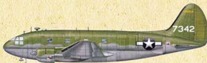
Curtiss C-46 Commando.